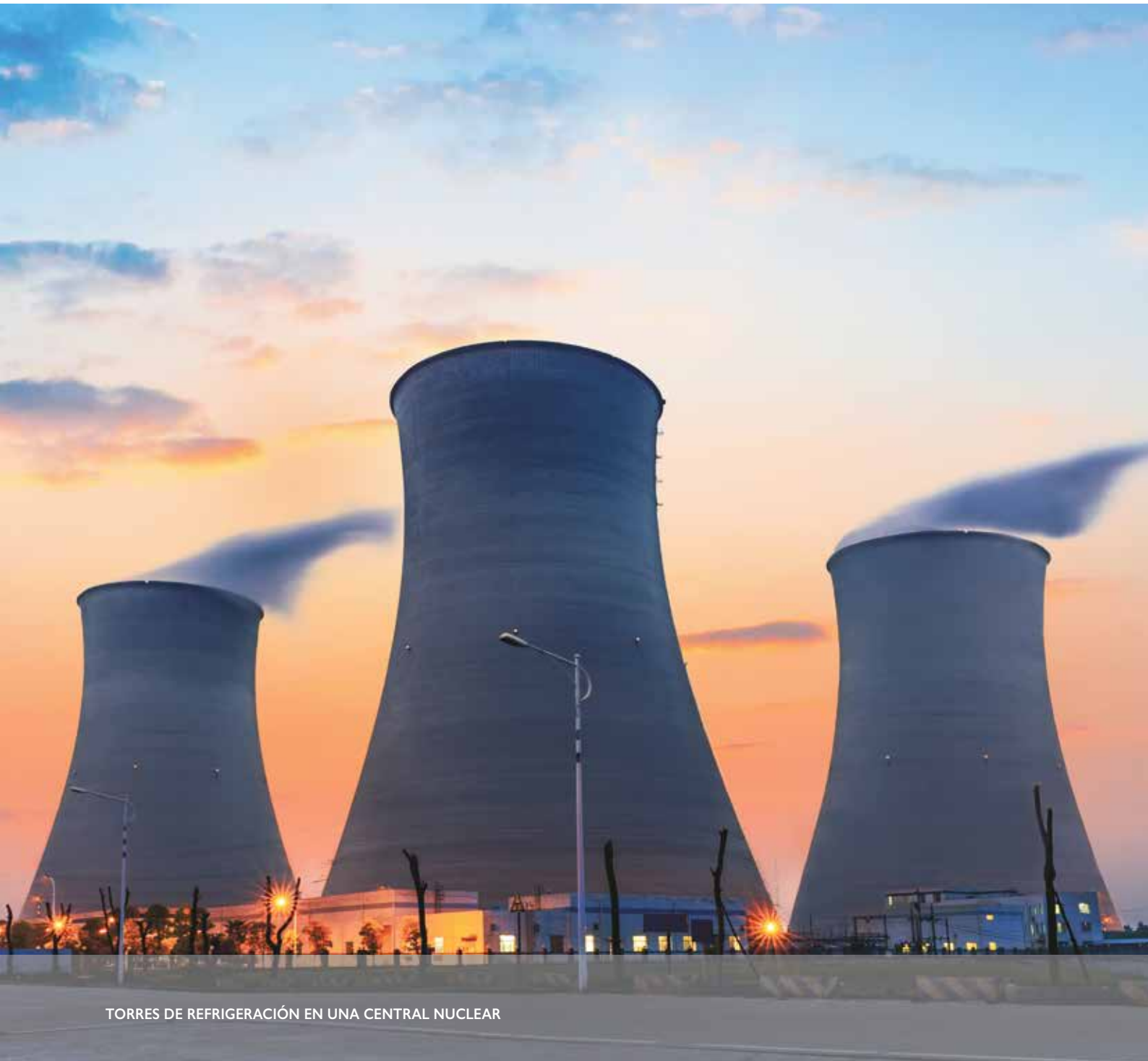
TORRES DE REFRIGERACIÓN EN UNA CENTRAL NUCLEAR

amortiguadores en los dispositivos de aprovechamiento de la energía mareomotriz, que forma parte del futuro de la producción de energía. El escaso mantenimiento que requieren los amortiguadores Oleo es una gran ventaja en todos estos casos, ya que permite un significativo ahorro de tiempo de trabajo.