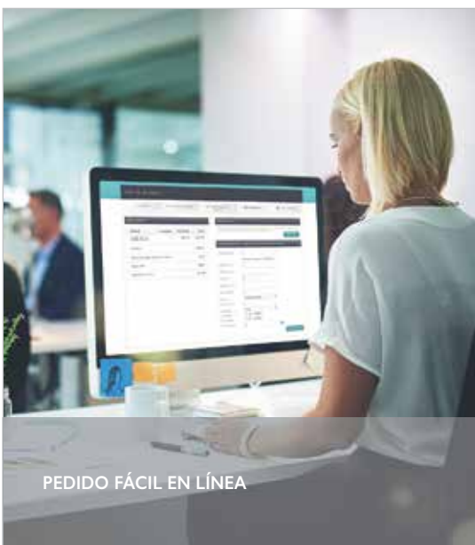
PEDIDO FÁCIL EN LÍNEA

Asimismo, se emplea un conjunto completo de pruebas ambientales para evaluar la calidad del revestimiento del émbolo, del acabado de la pintura y del fuelle.