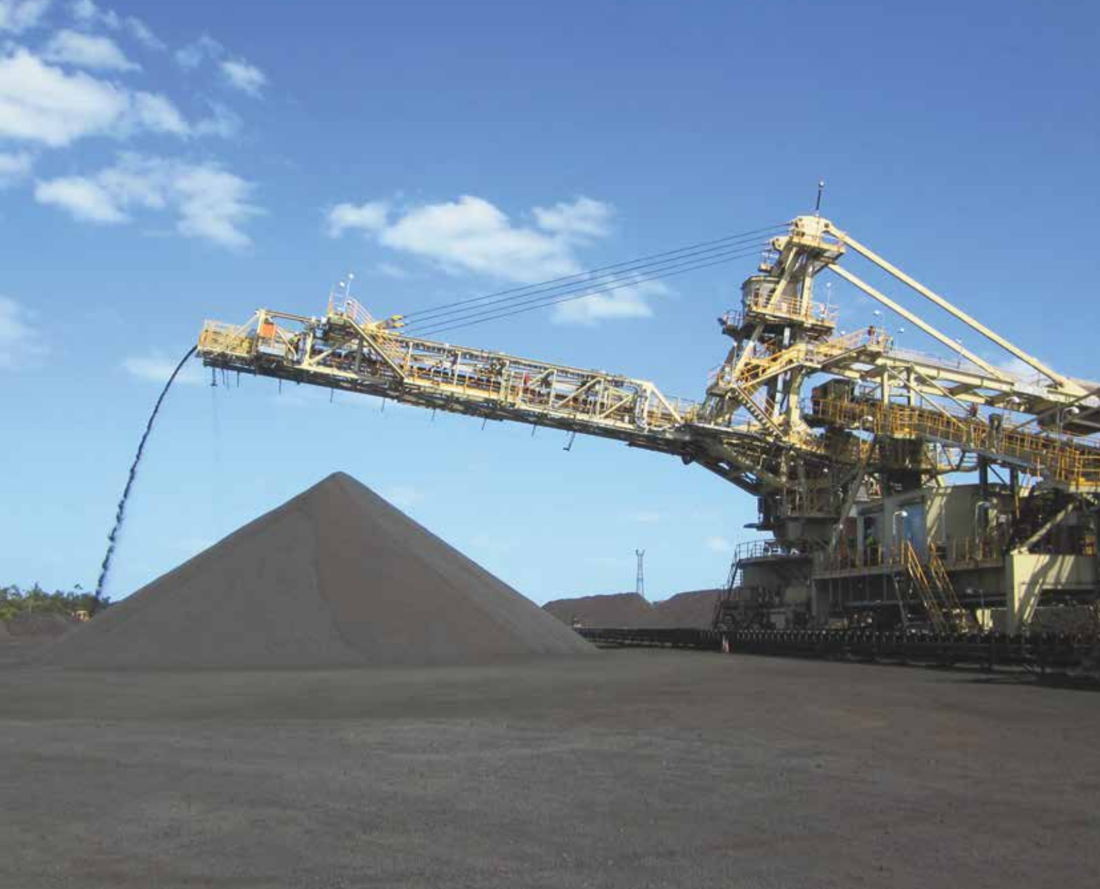
APILADORA PARA MANEJO DE MATERIAL A GRANEL