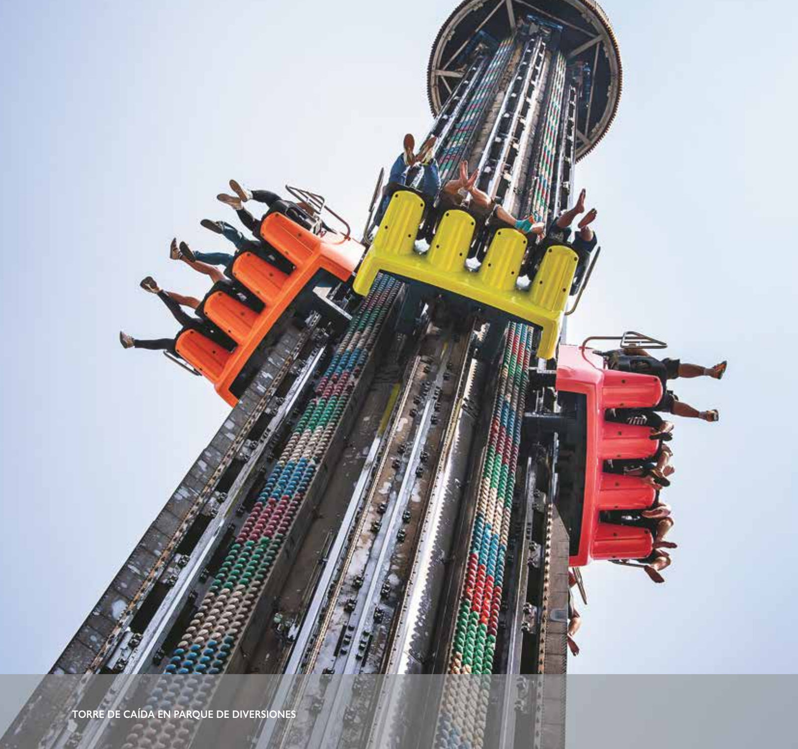
TORRE DE CAÍDA EN PARQUE DE DIVERSIONES