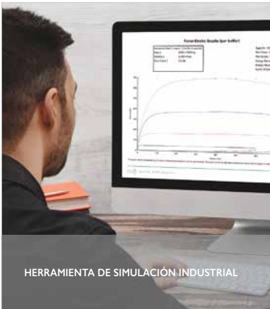
HERRAMIENTA DE SIMULACIÓN INDUSTRIAL