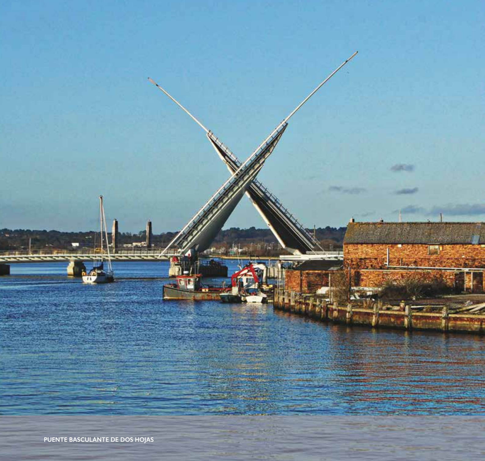
PUENTE BASCULANTE DE DOS HOJAS