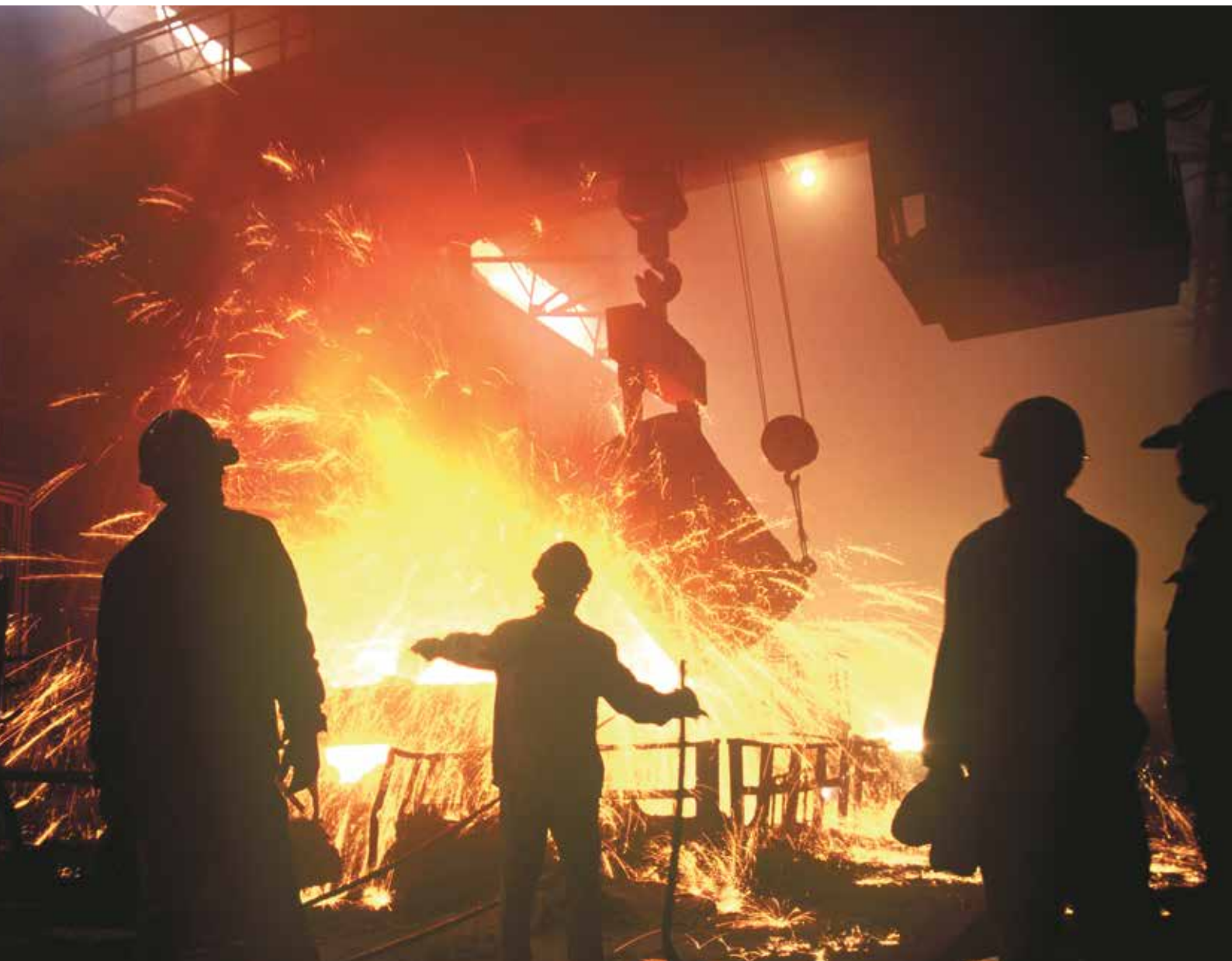
PUENTE GRÚA EN PLANTA DE FUNDICIÓN DE ACERO