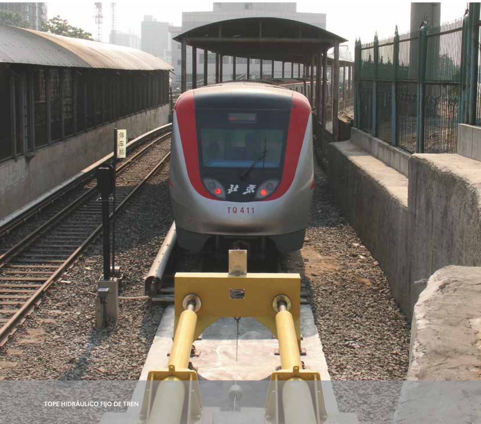
TOPE HIDRÁULICO FIJO DE TREN

de una profunda comprensión del desempeño de los trenes mediante pruebas y simulaciones de impacto, lo que permite ofrecer a la industria soluciones eficientes y eficaces en materia de topes en caso de que un tren no se detenga. Al disipar la energía de impacto a través de abrazaderas de fricción, amortiguadores hidráulicos de gas o una combinación de ambos, cada solución se optimiza para proporcionar las tasas de desaceleración más bajas al tiempo que se mantienen distancias mínimas de instalación.