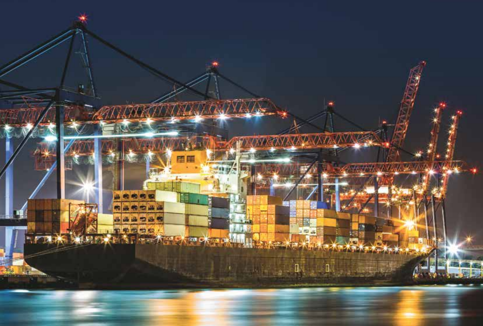
BUQUE DE CARGA EN TERMINAL DE CONTENEDORES