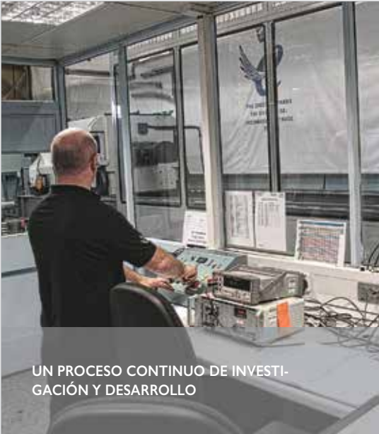
UN PROCESO CONTINUO DE INVESTIGACIÓN Y DESARROLLO